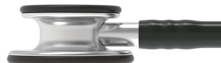
3M™ Littmann® Classic III™

Permet d'isoler les sons les plus subtils, afin que vous puissiez percevoir le moindre changement chez vos patients dans des environnements les plus exigeants et les plus critiques.