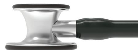
3M™ Littmann® Cardiology IV™

Permet d'isoler les sons les plus subtils, afin que vous puissiez percevoir le moindre changement chez vos patients dans des environnements les plus exigeants et les plus critiques.