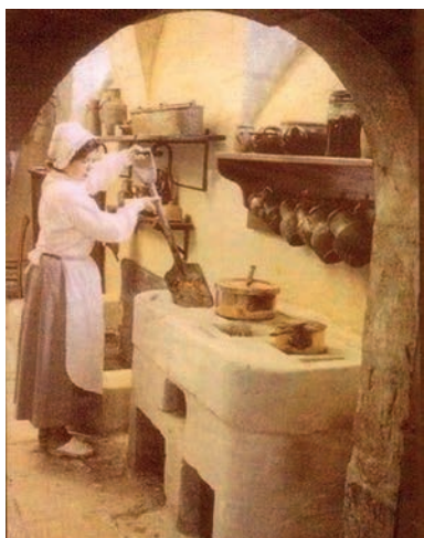
Le potager était aussi le nom d'un fourneau maçonné, que l'on chargeait de braises, comme s'y active ici une cuisinière, dans la cuisine d'une maison de maître (fin XIX e siècle).