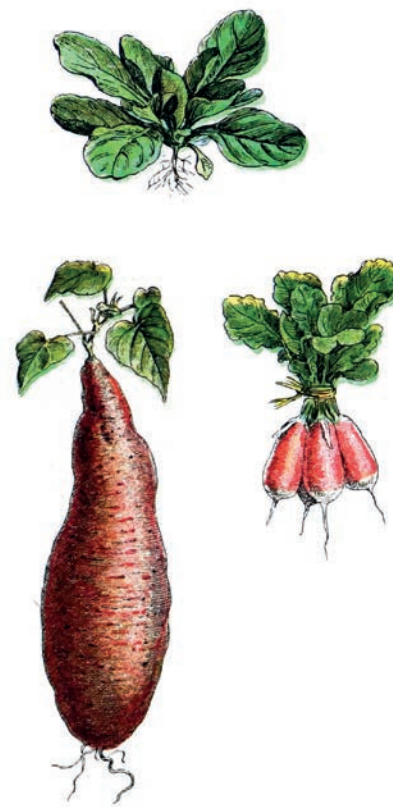
Double page précédente

Mais d'où vient pour sa part l'appellation de plantes potagères pour désigner certaines plantes comestibles ? En Europe depuis des siècles, dans des lopins de terre proches de la maison, étaient cultivées, et sont parfois encore cultivées, quelques plantes pour nourrir la maisonnée. Panais, maceron, betterave, chou, carotte, radis, navet, céleri, laitue, chicorée, fenouil, chénopode, arroches accompagnaient en bouillon, brouet ou porée (purée de légumes verts hachés), les mets cuisinés dans des pots, d'où leur nom de potherbe et plus tard de potagères.