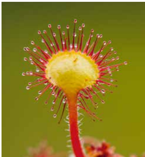
↑ Les poils collants d'un Drosera .