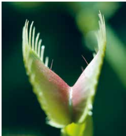
↑ Le piège de la dionée et ses poils sensibles.