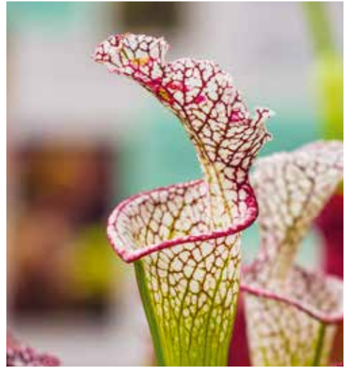
↑ Pièges à urnes de Sarracenia leucophylla .