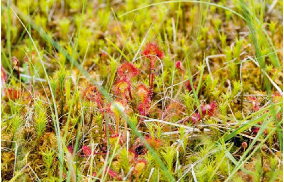
↑ Drosera rotundifolia en milieu naturel.

Encore faut-il préciser que la notion de milieux « pauvres » ou « carencés » est toute relative puisqu'ils constituent l'habitat normal des plantes carnivores. Ce que nous appelons des milieux « riches », ou « normalement pourvus », peuvent leur être tout à fait toxiques... Elles s'y trouvent, par ailleurs, confrontées à la concurrence des végétaux classiques, qui prennent alors le dessus.