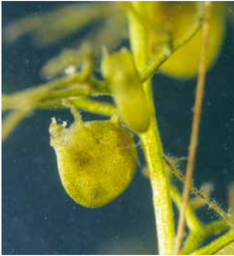
↑ Pièges à aspiration des utriculaires.