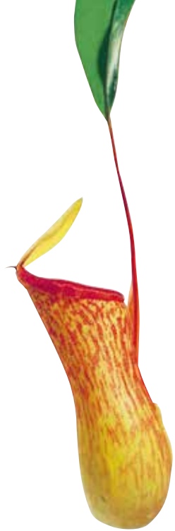
↑ Urne de Nepenthes 'Emmarene'.

transformées, nommées dans le langage botanique « ascidies », forment des pièges d'où les proies n'arrivent plus à s'échapper. En aucun cas les clapets qui se trouvent au sommet de certaines de ces urnes ne se referment sur leurs proies: la capture reste passive. On distingue parfois trois zones: une première zone, destinée à attirer les insectes au moyen de nectar et de couleurs remarquables; une deuxième zone, cirreuse, sur laquelle les insectes glissent; une troisième zone, enfin, dans le fond de l'urne, remplie d'eau ou de suc digestifs dans lesquels les insectes se noient et sont digérés. Pour mémoire, les champignons Holenbuehelia et Resupinatus , quant à eux, utilisent des disques adhésifs, d'autres des nœuds coulants.