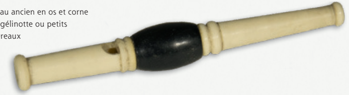
Appeau ancien en os et corne pour gélinotte ou petits passereaux

En Égypte, sur le site de l'ancienne Nekhen (cité du dieu faucon, Horus), une palette datant d'environ 3000 à 2700 avant notre ère a été mise au jour. Y figure un homme, affublé d'une peau de chacal, qui tient à la bouche un objet évoquant une flûte. Le personnage étant entouré de divers animaux, dont un cervidé, l'hypothèse a été émise qu'il pourrait s'agir d'un chasseur utilisant un appeau.