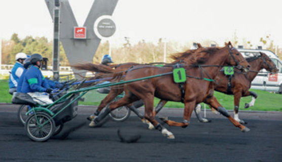
Le cheval trotteur réformé fait une bonne monture de selle, notamment pour la randonnée.