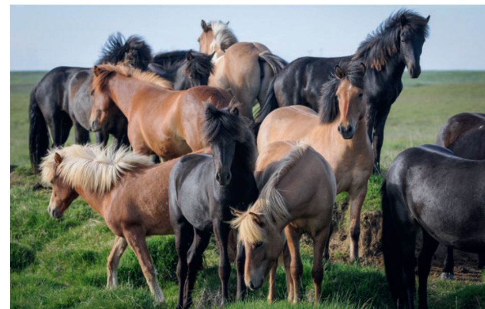
Grand ou petit ? Robe claire ou foncée ? Race ? Les choix sont multiples pour trouver le cheval qui vous convient le mieux.

Acheter un poulain nécessite de devoir attendre qu'il ait au moins 3 ans pour le débourrer et faire sa première éducation. Il devra cependant avoir atteint 5 à 6 ans avant de le faire pleinement travailler. Avant d'acheter un cheval, pour s'assurer de l'intégrité de ses membres, il est conseillé