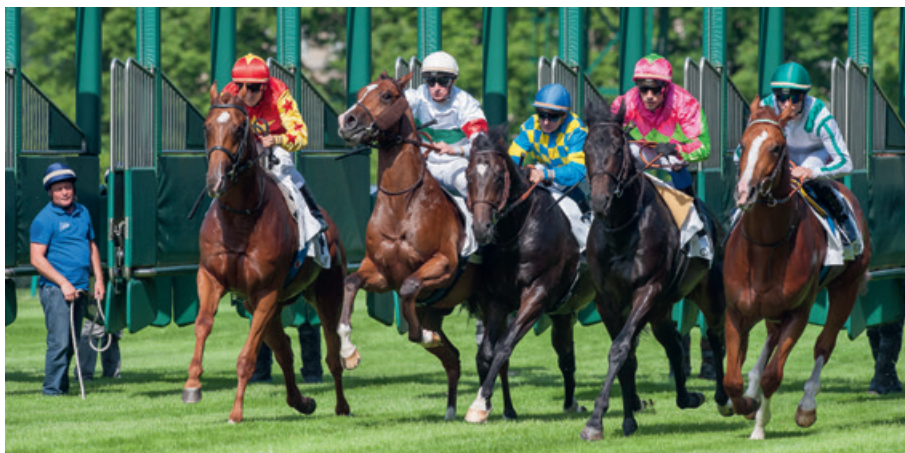
Le pur-sang anglais est le cheval le plus rapide du monde. Ici, ils jaillissent des « boîtes », pour se mesurer sur un champ de course.

• Le Camargue , élevé à l'extérieur, est rustique, très maniable et bon porteur, malgré sa taille modeste. Sélectionné pour une équitation de travail du bétail, il convient bien à une équitation de loisir.