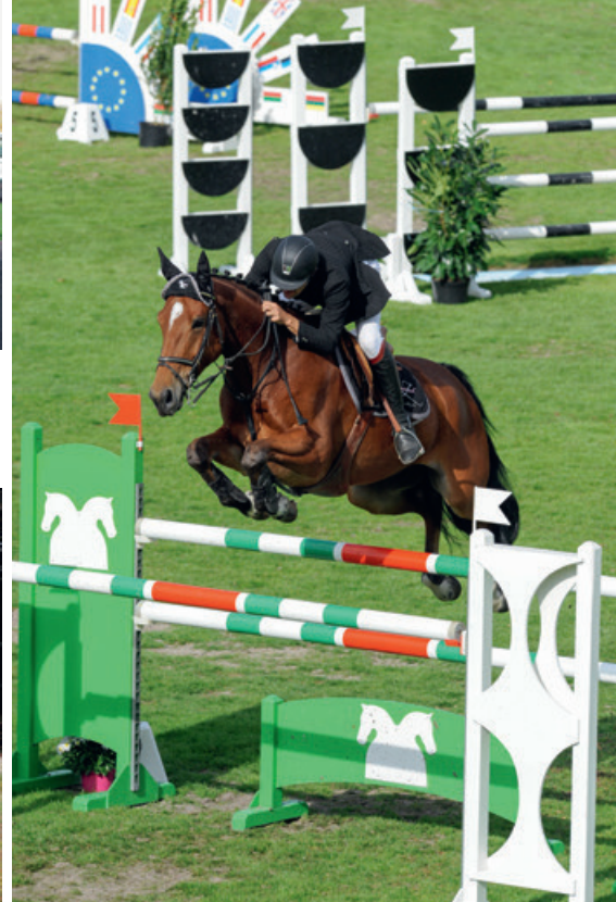
Les chevaux de race selle français, sélectionnés pour leurs aptitudes à l'obstacle, brillent sur de nombreux terrains de concours.