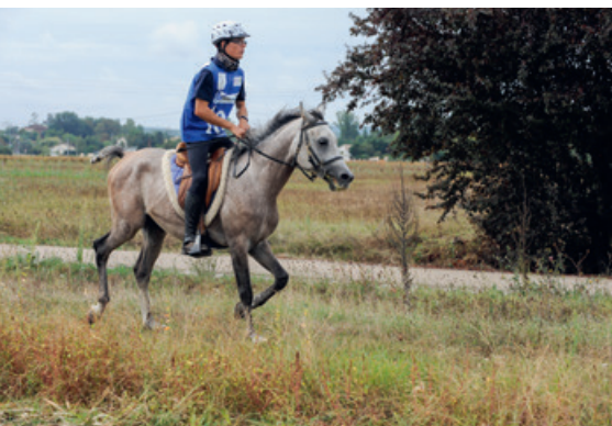
Les chevaux d'endurance sont généralement de race arabes, réputés pour leur résistance lors de longues courses.