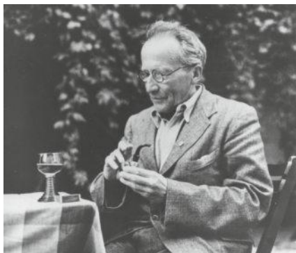
Erwin Schrödinger, au milieu de sa vie, se reposant au grand air.

correspondances privées lorsque le propos s'y prêtait. Ce fut le cas, en 1943, après qu'Einstein avoua personnellement à Schrödinger qu'un certain modèle d'unification avait été «le tombeau de ses espoirs» dans les années 1920, ce dernier exploita cette déclaration de façon à donner l'impression qu'il avait réussi là où Einstein avait échoué. Il lut publiquement la lettre devant l'Académie royale d'Irlande, se vantant d'avoir «exhumé» les espoirs d'Einstein grâce à ses calculs. La conférence fut rapportée dans l' Irish Times , qui couronna l'article avec le titre fallacieux «Hommage d'Einstein à Schrödinger 7 ».