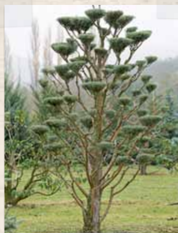
Cupressus arizonica 'Glauca'