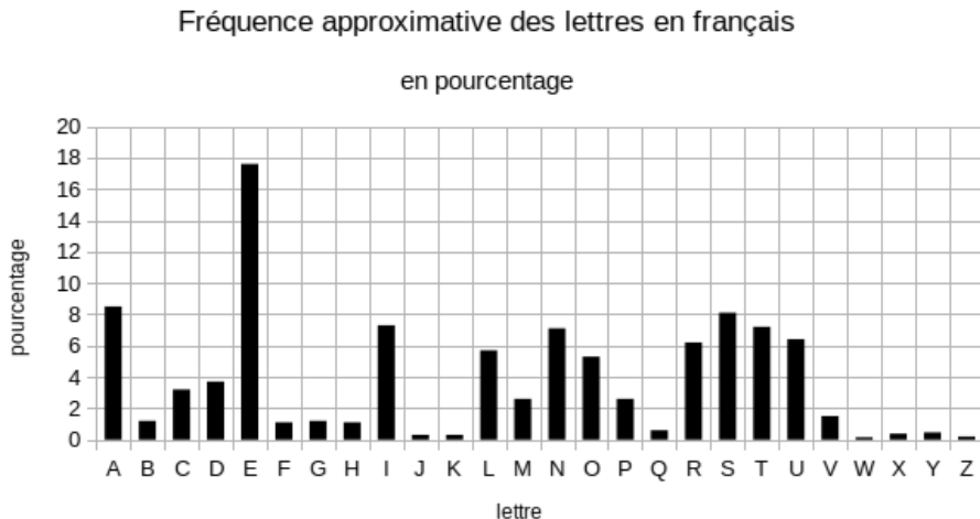
FIGURE 1.2 – Fréquence d’usage des lettres en langue française. On voit que les lettres E et A sont parmi les plus utilisées.