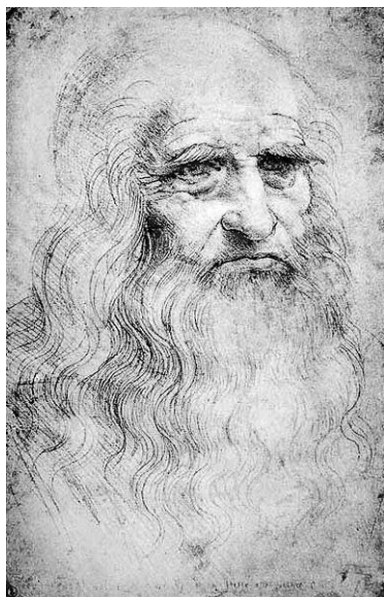
Léonard de Vinci (1452-1519)

Léonard de Vinci avait parfaitement compris la raison de la présence de coquilles et de poissons dans les strates. Dans son manuscrit intitulé Des os de poissons qui se trouvent dans les poissons pétrifiés , écrit avant 1519, il explique clairement comment lors de crues, des poissons de rivières se sont retrouvés dans des terrains d'abord humides qui se sont ensuite asséchés et sont devenus pierre. Mieux, il suppose des rivages qui se sont élevés à des hauteurs semblables à celles où sont connues actuellement des coquilles.