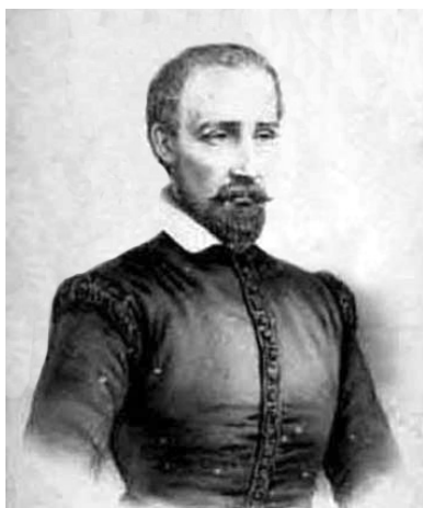
Bernard Palissy (≈1510-1589) « Le potier de terre, qui ne sçavoit ni Latin ni Grec »

À l'opposé de Goropius cependant, d'autres voix se font entendre. Le naturaliste italien Andrea Cesalpino, qui fut un temps médecin personnel du pape Clément VIII, estime, en 1596 dans son De Metallicis , que les fossiles « ont existé en tant qu'êtres vivants, mais se sont ensuite durcis en une substance pierreuse, soit d'eux-mêmes, soit par quelque suc lapidescent ». Cesalpino n'est pas le premier à subodorer une telle origine organique. Dès le XIII e siècle, Albert von Bollstädt, connu sous le pseudonyme d'Albert le Grand, reprenant lui-même les idées formulées par Avicenne dans son ouvrage De la congélation et de la conglutination de la pierre publié vers 1200 par Alfred de Sareshel au livre IV des Météorologiques d'Aristote, écrivait, dans son Traité des minéraux paru seulement en 1499, que « Des animaux peuvent, en entier, se transformer en pierres » mais, il est vrai, qu'il citait aussi le cas d'un nid d'oiseaux fossilisé avec ses petits et semblait également postuler une possible génération in situ .