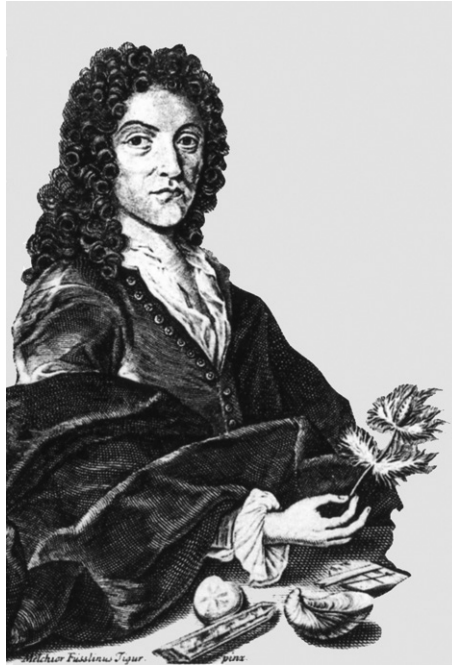
Johann Jacob Scheuchzer (1672-1733)

On terminera l'histoire du Déluge par une citation d'Henri Bernardin de Saint-Pierre qui explique dans ses Études de la Nature en 1804 que « Chaque couche de nos fossiles fut le résultat d'une marée universelle. Pendant que les effusions des glaces polaires couvroient les extrémités occidentales de notre continent des dépouilles de la mer, elles étaloient sur ses extrémités orientales celles de la terre même, et déposaient sur le sol de la Chine des lits de terre végétale, de trois à quatre cents pieds de profondeur. Ce fut alors que tous les plans de la nature furent renversés. Des îles entières de glaces flottantes, chargées d'ours blancs, vinrent s'échouer parmi les palmiers de la zône torride ; et les éléphants de l'Afrique furent roulés jusques dans les sapins de la Sibérie, où l'on retrouve encore leurs grands ossemens ». Cette élucubration poétique se passe de commentaire.