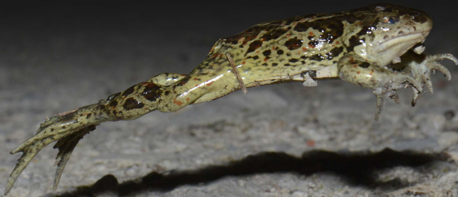
Saut d'un Pélobate brun ( Pelobates fuscus ).

L'évolution du squelette a permis l'adaptation au saut : l'urostyle transfère la force du saut au reste du corps ; sur les pattes postérieures, le tibia et le fibula ont fusionné pour donner le tibio-fibula ; sur le pied, les deux os tarsiens et les orteils sont longs, ce qui permet de répartir la force sur une grande surface.