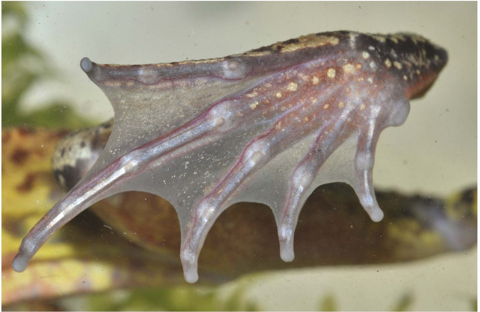
▲ Pied avec les cinq orteils palmés d'une Grenouille rousse ( Rana temporaria ). La palmure sert à la nage, mais tous les anoures n'en possèdent pas.