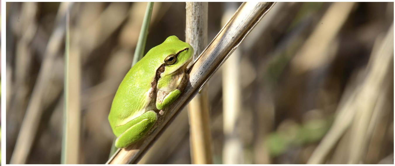
♣ Rainette méridionale ( Hyla meridionalis ).

On estime l'apparition des amphibiens à – 360 millions d'années, mais les premières vraies grenouilles connues datent toutes du Jurassique : Vieraella herbstii (Argentine, – 180 Ma) et Prosalirus sp. (Arizona, – 185 Ma). Reste le cas de Triadobatrachus qui est une « pré-grenouille » (environ – 250 Ma).