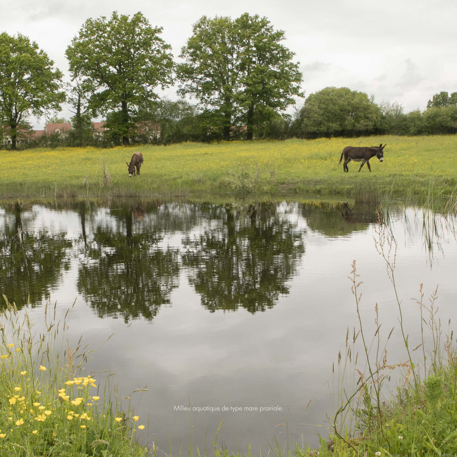
Milieu aquatique de type mare prairiale.