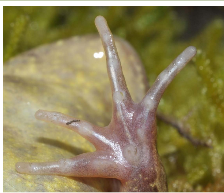
▲ Main avec quatre doigts d'une Grenouille rousse ( Rana temporaria ).

On peut estimer l'âge d'un anoure grâce à une méthode appelée « squelettochronologie ». À partir d'une phalange ou d'un fémur, il est possible de voir les lignes d'arrêts de croissance qui se forment sur l'os lors des hibernations. Une étude en milieu naturel portant sur les Crapauds épineux ( Bufo spinosus ) de Bretagne a déterminé par cette méthode une longévité maximale de 12 ans pour un mâle et de 9 ans pour une femelle. Il semble que les populations d'altitude vivent plus longtemps. On rapporte qu'en Suisse la longévité des Crapauds communs ( Bufo bufo ) serait de 13 ans pour les mâles et de 18 ans pour les femelles. Un record de longévité de 36 ans, repris dans la littérature, n'a jamais été vérifié et semble très exagéré.