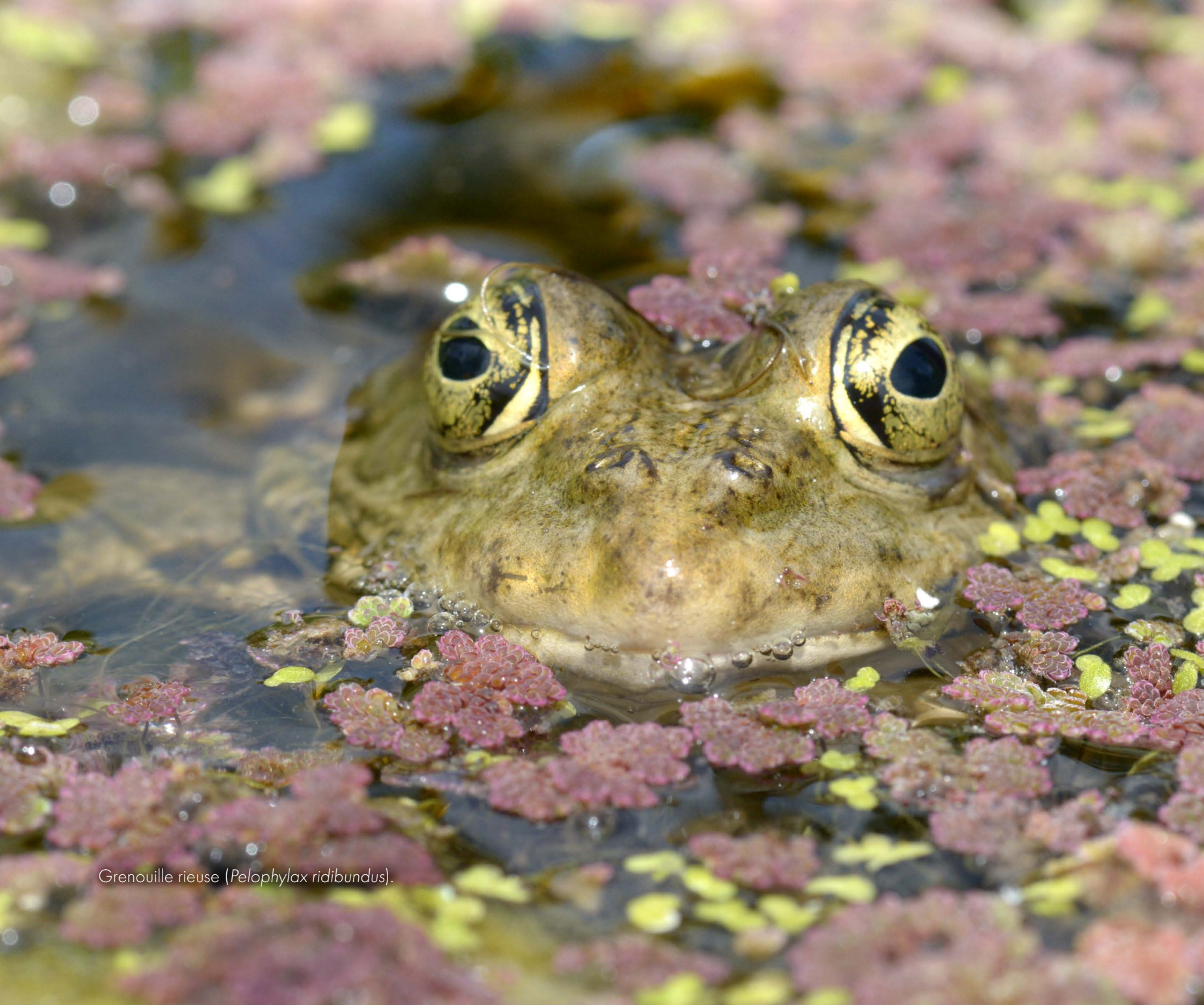
Grenouille rieuse ( Pelophylax ridibundus ).

Grenouilles, crapauds, rainettes et d'autres animaux ressemblants, aux noms moins connus, appartiennent au même groupe : les anoures, du grec anura , « sans queue ». En effet, lors de la métamorphose, la queue des juvéniles régresse jusqu'à disparaître complètement chez l'adulte. En France métropolitaine, on dénombre 29 espèces d'anoures. Les termes « crapaud » et « grenouille » sont sans justification dans la classification. Cependant, on s'accorde pour définir les « vrais crapauds » par la présence de glandes à venin derrière les yeux, l'absence de dents, une peau glanduleuse et des membres postérieurs courts, inaptes au saut : ce sont les Crapauds communs, épineux, verts et calamites. Les grenouilles, elles, se caractérisent par une peau plus ou moins lisse, des dents pédiculées sur la mâchoire supérieure et des pattes postérieures puissantes, adaptées au saut (grenouilles vertes et brunes). Quant aux rainettes, elles ont une peau lisse et des pelotes adhésives au bout des doigts. La description des autres anoures, tels que les pélobates, pélodytes, sonneurs, alytes et discoglosses, ne permet de les ranger dans aucune de ces trois catégories.