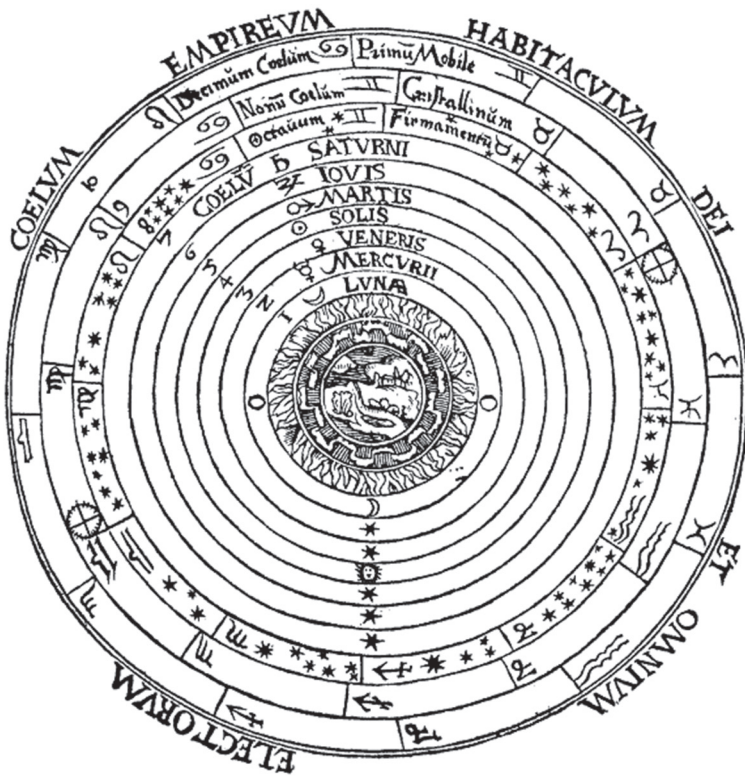
Le système géocentrique de Ptolémée.

position d'un émissaire des mondes célestes, chargé d'annoncer et de traduire pour l'humanité les secrets du cosmos. À l'âge de quarante-six ans, il publie ainsi son premier grand ouvrage scientifique. La facilité de lecture et les découvertes qu'il y relate lui valent immédiatement une très grande popularité et le soutien de personnalités influentes, dont l'une n'est autre que le futur pape Urbain VIII. Cependant, le texte révèle déjà en filigrane la