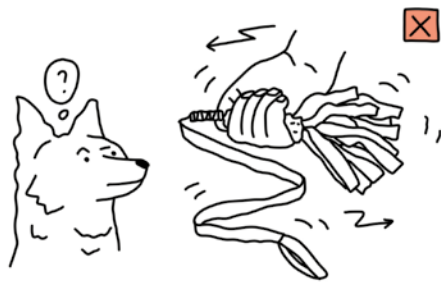
LE LAPIN ÉPILEPTIQUE