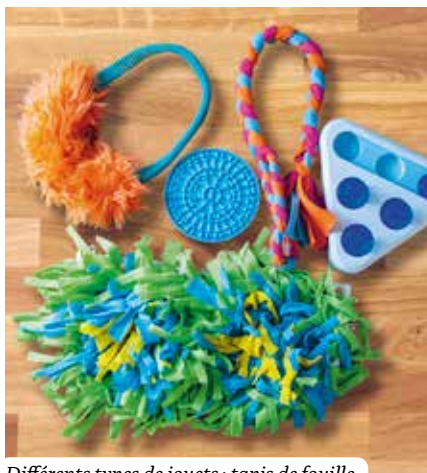
Différents types de jouets : tapis de fouille, jeux d'intelligence, tugs, tapis de léchage.