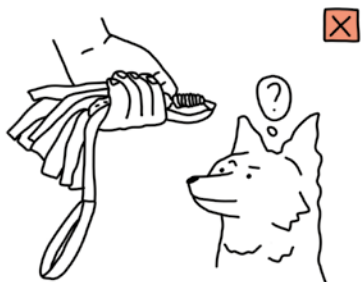
LE LAPIN MORT