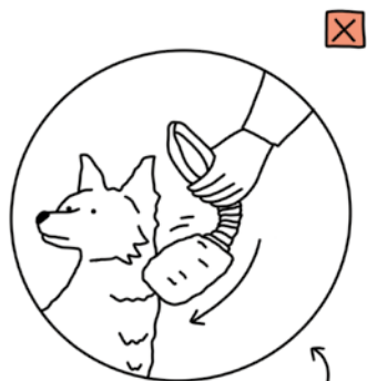
LE LAPIN SUICIDAIRE