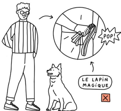
LE LAPIN MAGIQUE