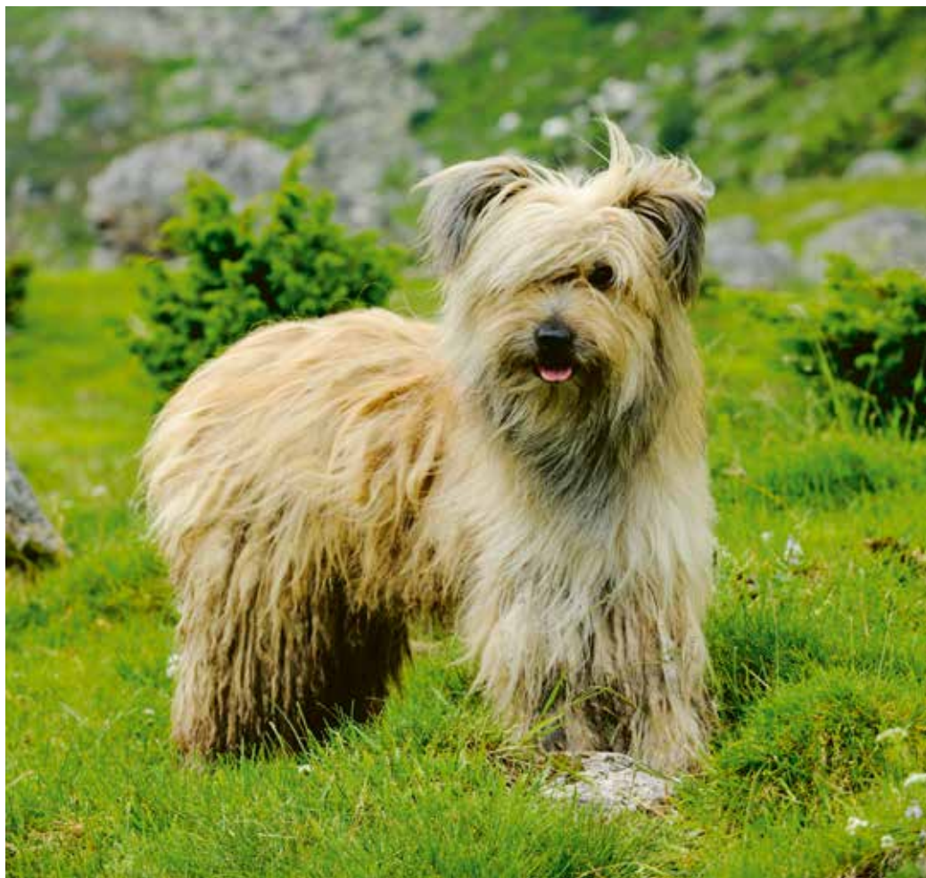
Pour les amateurs de randonnées, un chien de type berger est idéal.

Les réponses seront déterminantes. Les chiens de grande taille de type Terre-neuve ou Leonberg ne vous accompagneront pas pour de longs footings et ne seront pas non plus idéaux pour regarder la télévision avec vous sur le canapé. À l'inverse, des chiens de type Border Collie ou Berger Belge seront malheureux et adopteront sans doute des comportements déviants si vous ne les stimulez pas assez physiquement et intellectuellement. Enfin, n'offrez pas un chien, quel qu'il soit, à votre enfant, si vous n'avez pas le temps de vous en occuper vous-même.