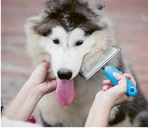
Certains types de poils nécessitent un brossage quotidien.