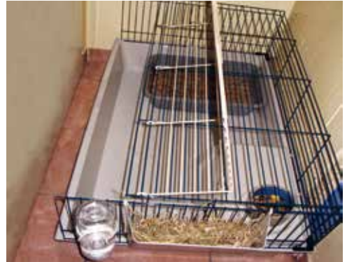
▲ Un coin toilettes d'un côté, un coin repas de l'autre, et un coin repos entre les deux : voici une cage qui comprend parfaitement les besoins de son locataire !