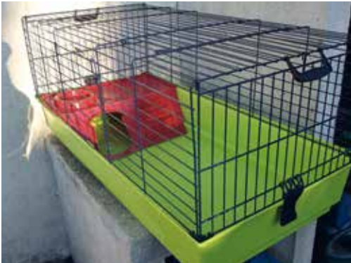
▲ Une cage à fond lisse pour un nettoyage facile et rapide.