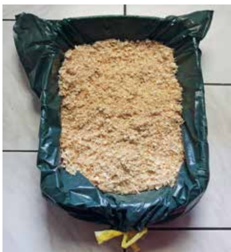
▲ Voici un WC trois étoiles pour un lapin propre et un maître comblé.