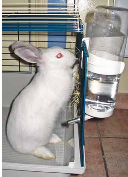
▲ Du foin à volonté, il n'y a pas mieux pour la santé !

Pour ce qui est de l'aspect pratique des choses, le foin que l'on achète