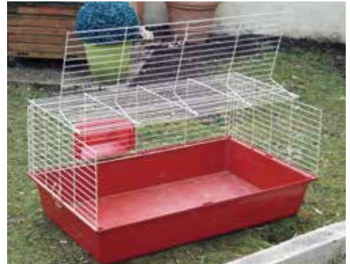
▲ Une cage à fond quadrillé double le temps d'entretien.

concevoir vous-même son habitat, car on ne trouve hélas rien d'adapté à sa taille dans le commerce pour le moment.