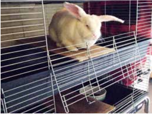
▲ Géant du Bouscat dans une cage triplex.