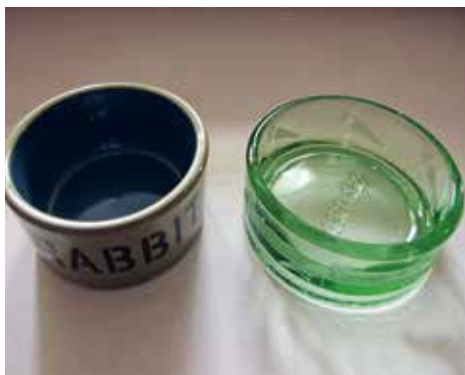
▲ Ces écuelles spéciales pour lapin en grès ou verre épais seront bien difficiles à renverser... !

S'agissant de l'eau : surtout pas d'écuelle, car votre ami aurait rapidement de graves problèmes de peau, dus à l'humidité permanente sur son menton. Il faut donc opter pour un biberon, et de grande taille, le lapin étant un animal qui boit beaucoup.