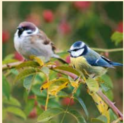
Le moineau friquet et la mésange bleue se montrent toute l'année dans les jardins, souvent ensemble.