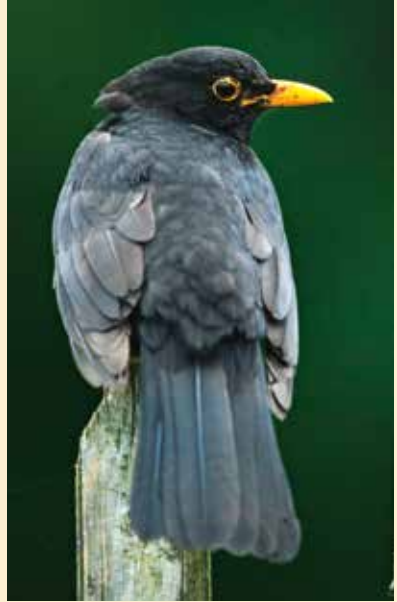
Le bec d'un jaune lumineux et le cercle clair autour de l'œil sont typiques du merle mâle.

Dans les pages qui suivent, 61 espèces d'oiseaux de jardin d'Europe tempérée sont présentés par catégorie de taille : 10 espèces sont plus petites ou aussi petites qu'une mésange bleue, 31 sont à peu près de la taille d'un moineau et 20 sont aussi grandes ou plus grandes qu'un merle. Le classement à l'intérieur de chaque catégorie dépend de la taille et de la parenté entre espèces. La plupart des oiseaux sont figurés en entier, mais les plus grands sont représentés partiellement. Une autre photo plus petite de l'oiseau entier complète le portrait.