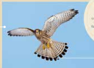
Ce crécerelle vole sur place, « en Saint-Espirit », pour guetter les proies comme les campagnols.

Le faucon crécerelle s'installe volontiers dans les rizières, posés contre un bâtiment ou dans un grenier avec un accès facile. Les gâtreaux couverts de noix de terre servent de perchoirs pour la nuit.